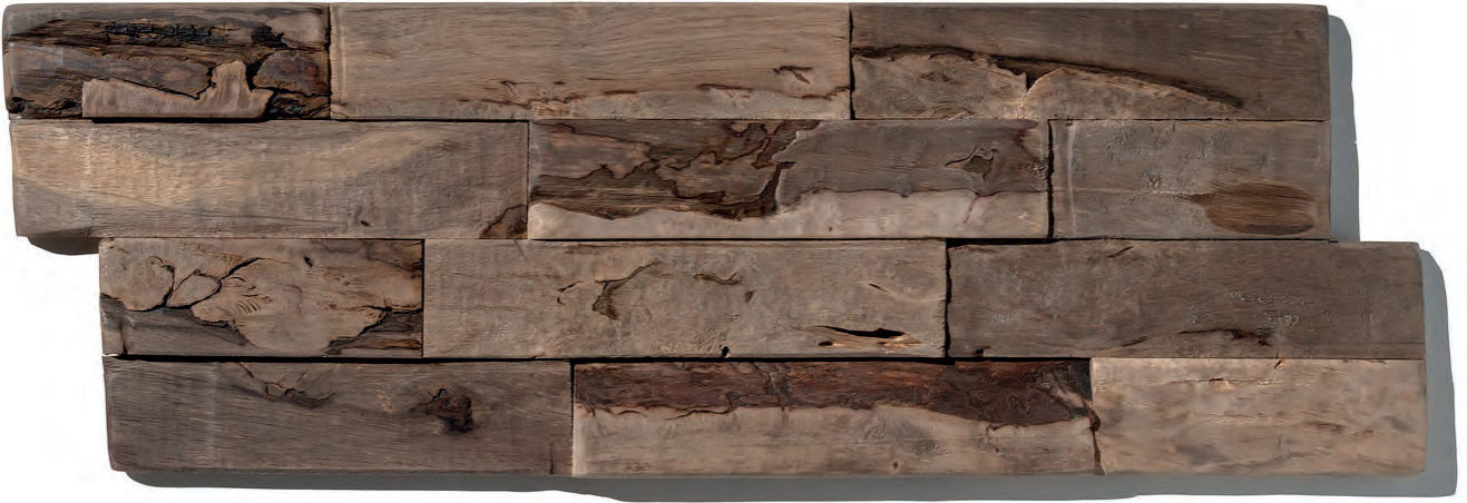
BALI SEA WS08 (OP BESTELLING, SUR COMMANDE, ON ORDER*)

*vraag naar de voorwaarden, demandez les conditions, ask for the terms