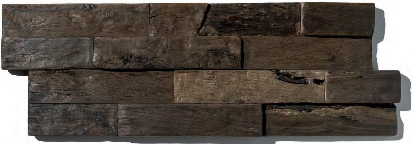
SOLOMON SEA WS06 (OP BESTELLING, SUR COMMANDE, ON ORDER*)