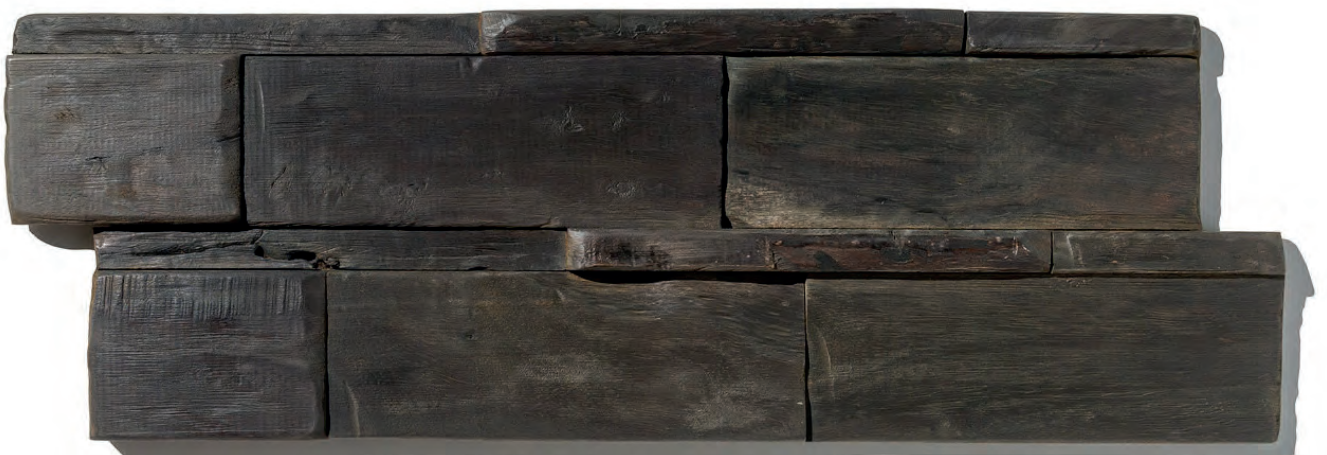
SULU SEA WS12 (OP BESTELLING, SUR COMMANDE, ON ORDER*)