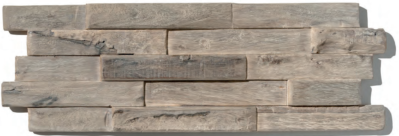
SALIS SEA WS01 (OP BESTELLING, SUR COMMANDE, ON ORDER*)