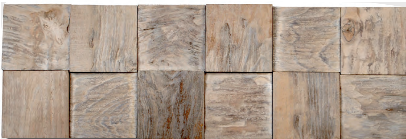
JAVA ETC92SB (OP BESTELLING, SUR COMMANDE, ON ORDER*)