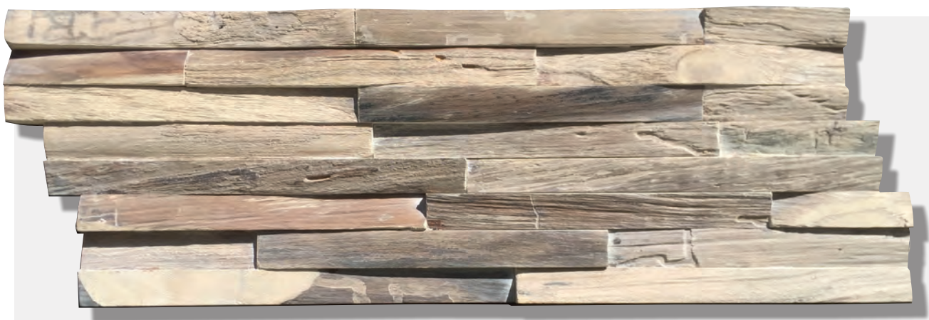
GUN SMOKED DA82050GS (OP BESTELLING, SUR COMMANDE, ON ORDER*)