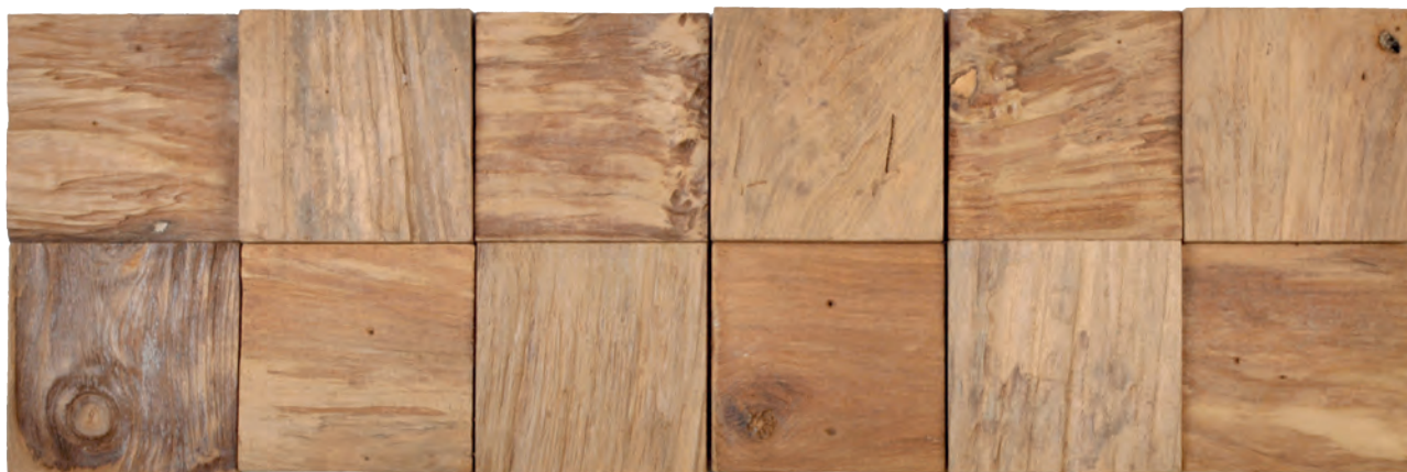
BALI ETC92N (OP BESTELLING, SUR COMMANDE, ON ORDER*)

*vraag naar de voorwaarden, demandez les conditions, ask for the terms