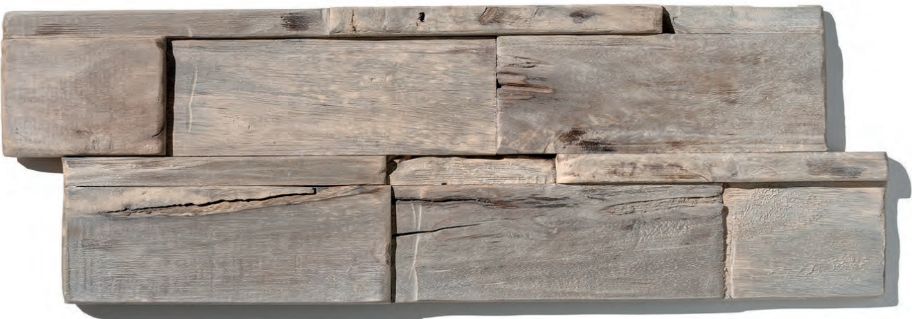
MOLUCCA SEA WS10 (OP BESTELLING, SUR COMMANDE, ON ORDER*)