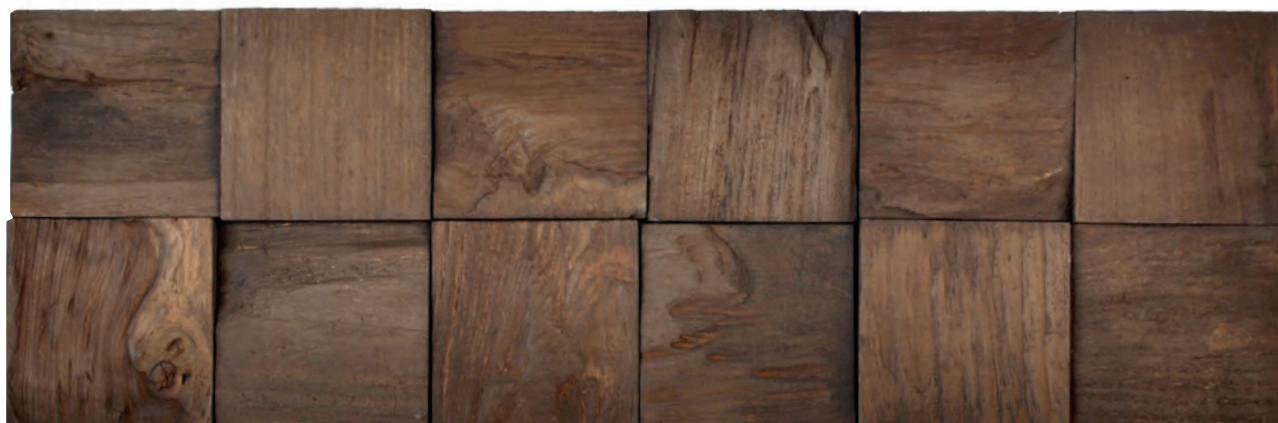
SULAWESI ETC92CH (OP BESTELLING, SUR COMMANDE, ON ORDER*)