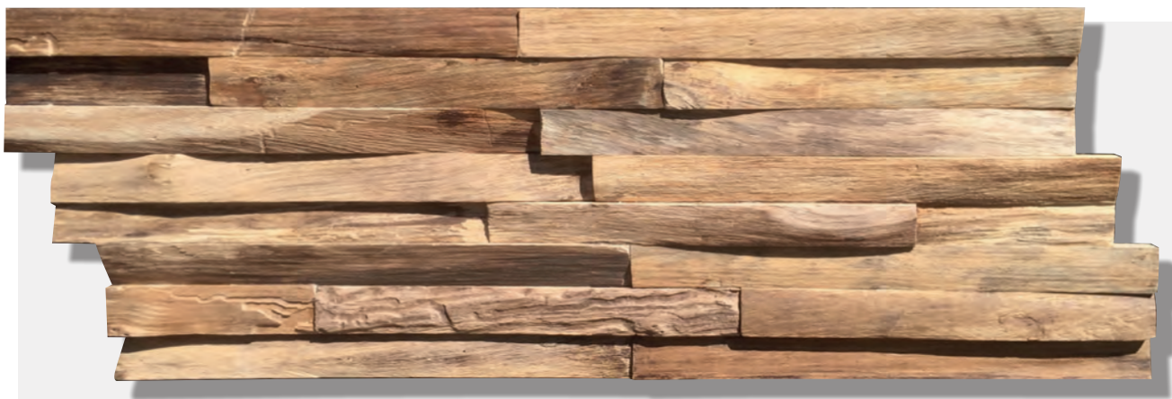
NATURE DA82050N (OP BESTELLING, SUR COMMANDE, ON ORDER*)

*vraag naar de voorwaarden, demandez les conditions, ask for the terms