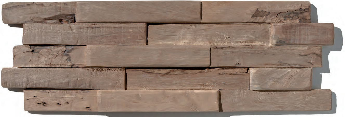
MINDANAO SEA WS66 (OP BESTELLING, SUR COMMANDE, ON ORDER*)

*vraag naar de voorwaarden, demandez les conditions, ask for the terms